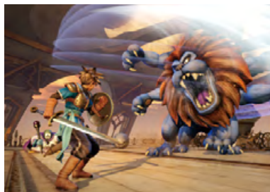
ドラゴンクエストヒーローズ 闇竜と世界樹の城 ©2015 ARMOR PROJECT/BIRD STUDIO/ KOEI TECMO GAMES/SQUARE ENIX All Rights Reserved.