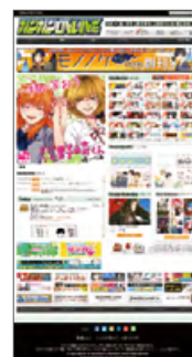
ガンガンONLINE