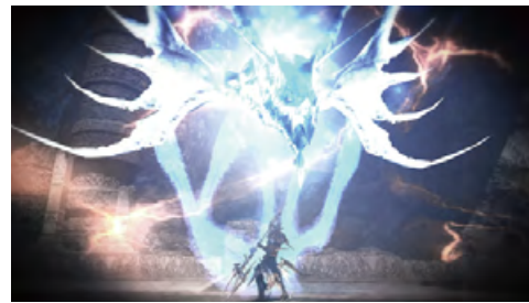
FINAL FANTASY XIV ©2010-2015 SQUARE ENIX CO., LTD. All Rights Reserved.

HD(ハイ・デフィニション)ゲームの新作は、2015年2月に「ドラゴンクエストヒーローズ 闇竜と世界樹の城」、3月に「FINAL FANTASY 零式HD」を投入しました。「ドラゴンクエストヒーローズ」は、「ドラゴンクエスト」シリーズ初の本格アクションRPGとしてシリーズの新しい魅力を引き出すことに成功しました。また「FINAL FANTASY 零式HD」は、過去にプレイステーション・ポータブル(以下、PSP)で発売した「FINAL FANTASY 零式」のHD版であり、PSP版が日本国内のみの発売であったことから欧米のユーザーからの要望が高かったものです。「FINAL FANTASY XV」の体験版も同梱し、国内外あわせて100万本を超えるヒットになりました。一方、こうした新作に加えて、カタログタイトル(既発タイトル)のフルゲームダウンロード販売も伸びてきており、従来よりも製品のライフサイクルが長くなってきております。こうした傾向は、豊かなタイトル資産を誇る私どもスクウェア・エニックス・グループに有利に働くものと期待しております。