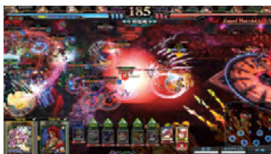
LORD of VERMILION III ©2007-2013 SQUARE ENIX CO., LTD. All Rights Reserved.

ライセンス・プロパティ等事業は、当社オリジナルコンテンツからはじまり、他社コンテンツも積極的に取り扱い、安定した事業となっております。高品質のマーチャンダイジング商品はお客様からの評価も高く、また最近ではコレクターズボックスといったファン向けの特別企画が好評を博しております。これらマーチャンダイジング製品は当社のコンテンツをより豊かにする重要なピースであり、これからも引き続き力を入れてゆきたいと考えております。