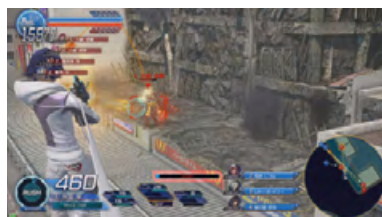
ガンズリンガー ストラトス2 ©2012, 2014 SQUARE ENIX CO., LTD. All Rights Reserved.