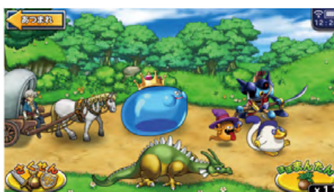
ドラゴンクエスト どこでもモンスターパレード ©2015 ARMOR PROJECT/BIRD STUDIO/SQUARE ENIX All Rights Reserved. ©SUGIYAMA KOBO Developed by ZENER WORKS inc.