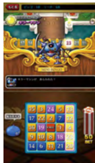
ドラゴンクエストX 冒険者の おでかけ超便利ツール