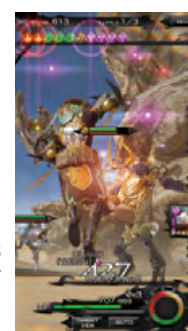
MOBIUS FINAL FANTASY ©2015 SQUARE ENIX CO., LTD. All Rights Reserved.