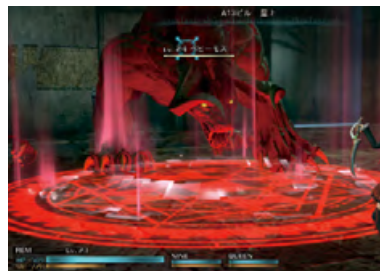
FINAL FANTASY零式HD ©2011, 2015 SQUARE ENIX CO., LTD. All Rights Reserved. CHARACTER DESIGN: TETSUYA NOMURA

2016年3月期は、欧米スタジオの大型タイトルを下期に相次いでリリースする計画です。PlayStation 4やXbox Oneも発売から2年が経過し、本格的な普及期に入ってきております。欧米各パブリッシャーも新規タイトルを次々と投入する構えを見せております。当社の2016年3月期のラインナップは、それらに十分比肩しうる強力な布陣であると自負しております。マーケットの盛り上がりとともに、競争もより激しさを増してきておりますが、年末商戦に向けて全力であたってまいります。