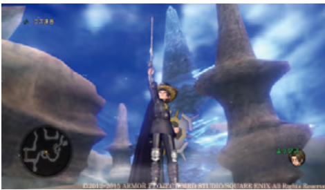
ドラゴンクエストX オンライン

MMOでは、「FINAL FANTASY XIV」、「ドラゴンクエストX オンライン」が安定的に収益を生み出せる態勢になり、収益の下支えとなりました。「ドラゴンクエストX オンライン」においては、「冒険者のおでかけ超便利ツール」の提供、スマートデバイスやニンテンドー3DSを使ったクラウドでの配信など、新しいサービス・試みにも取り組んできました。「FINAL FANTASY XIV」は、2014年8月に中国でのサービスを開始し、また2015年9月には韓国でのサービスも開始するなど、そのサービス地域の拡大を進めております。さらに両タイトルとも、2016年3月期は拡張ディスクを発売することで既存プレイヤーの維持、新規プレイヤーの獲得に努めており、当社の大きな収益バックボーンとなるべく、開発、サービスを続けております。