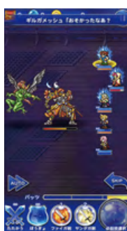
FINAL FANTASY Record Keeper