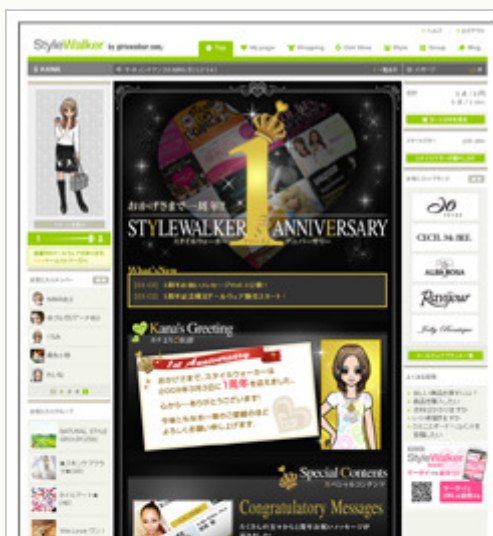
1周年記念企画コンテンツ (PC)

株式会社スタイルウォーカー(本社:東京都渋谷区、代表取締役社長:庄司 顕仁、以下スタイルウォーカー)は、女性向けコミュニティサイト「StyleWalker(スタイルウォーカー)」(PC・携帯電話対応、 http://www.style-walker.com/ )のサービス提供開始から1周年を迎え、ユーザーの皆様の日頃のご愛顧に感謝の意をこめて、1周年記念特集企画を実施いたします。